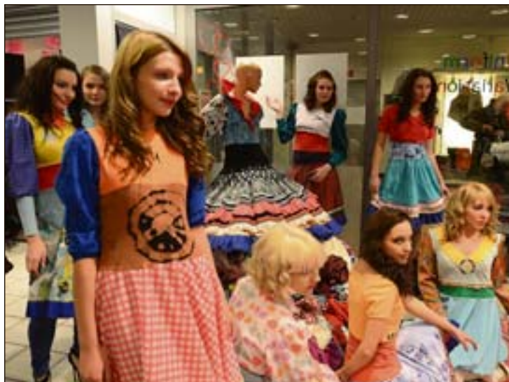
NYGAMMELT: Hele gjengen med modeller fra en videregående skole i Murmansk viser fram noen av nygamle plagg.